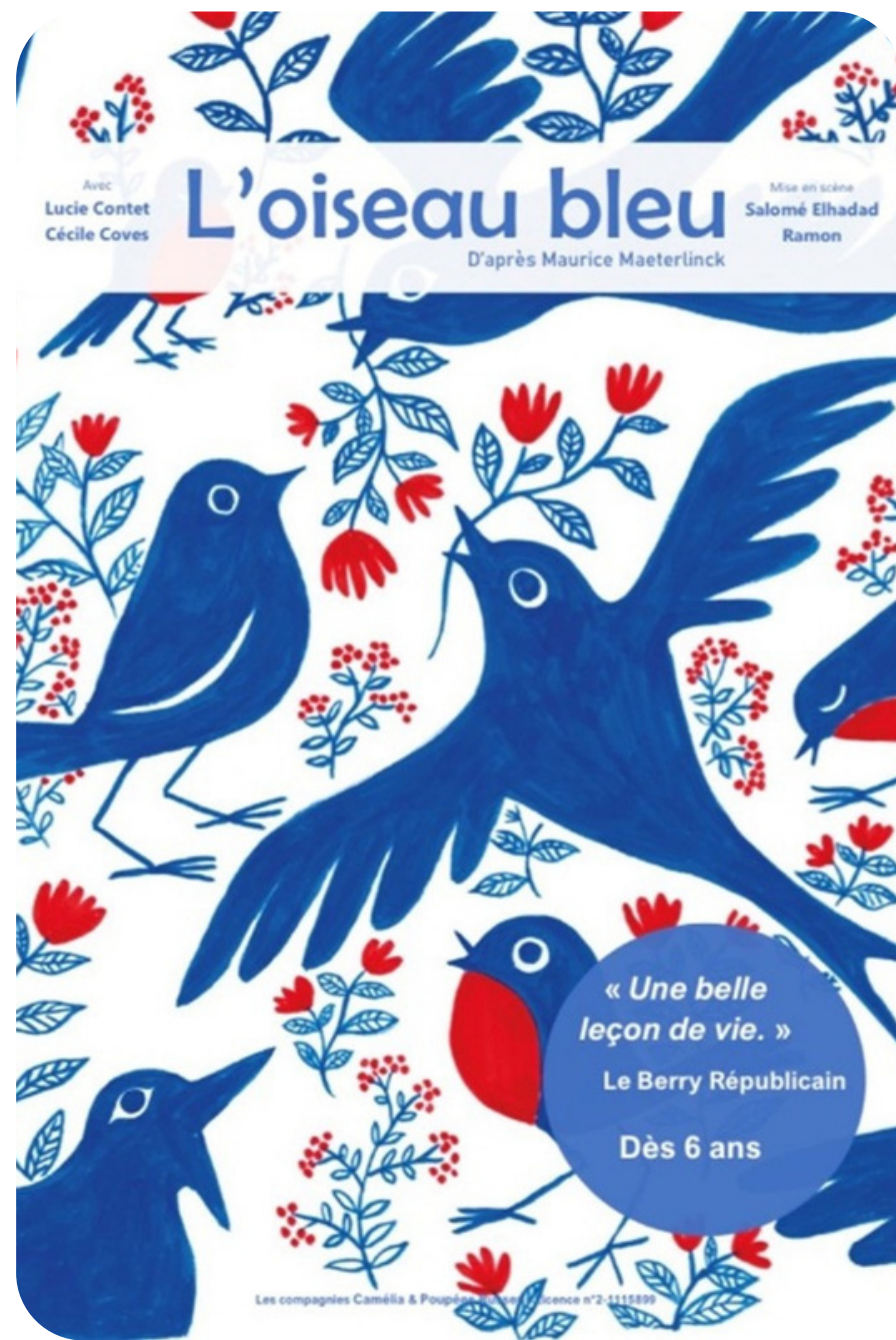
Illustration Eloïse Heinzer